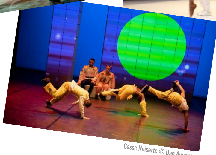
Casse Noisette