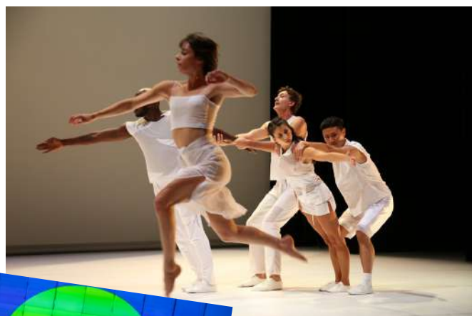
Ulysse © Guy Delahaye