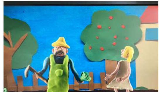
Projet "Petit Cinéma de Classe" à l'école Paul Vincensini de Reventin Vaugris