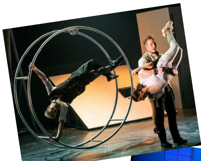
La Galerie

Durée 1h20 Public à partir de 12 ans Le Manège