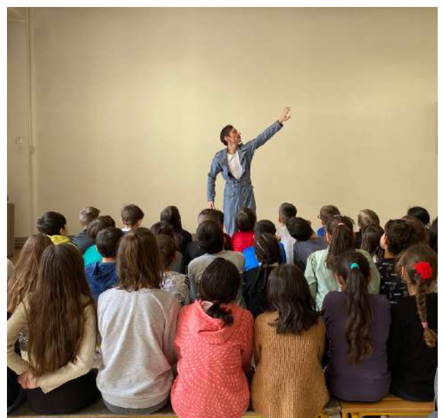
"Jon" du Théâtre du Lyon, avril 2022

Accueillez dans votre structure ou votre établissement scolaire (école, collège, lycée) le spectacle "Jon" d'après "Jonathan Livingston le Goéland" de Richard Bach.