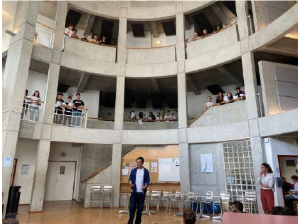
Projet "Frontière" poésie et mise en voix à l'Institution Robin - Lycée Ste Colombe