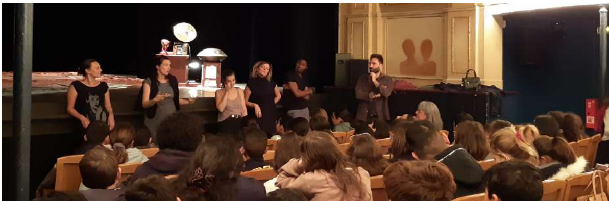
Bord plateau après la représentation de "Longtemps la nuit" de la Cie Qui Porte Quoi ?